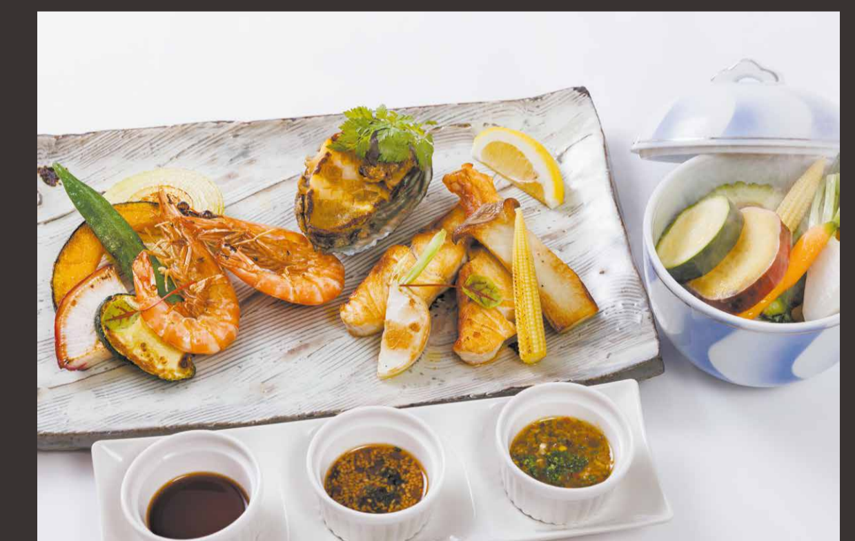
宮古島三大高級魚 (赤マチ/マフブ/アカジン/イラブチャー他)・ 鮑・車海老の鉄板焼き ~シェフデモンストレーション~ 季節の野菜鉄板蒸し焼き添え 又は 季節野菜のソテー

Ishihara Black Wagyu Beef Teppan-Yaki Steamed Seasonal Vegetables or Sautéed Seasonal Vegetables.