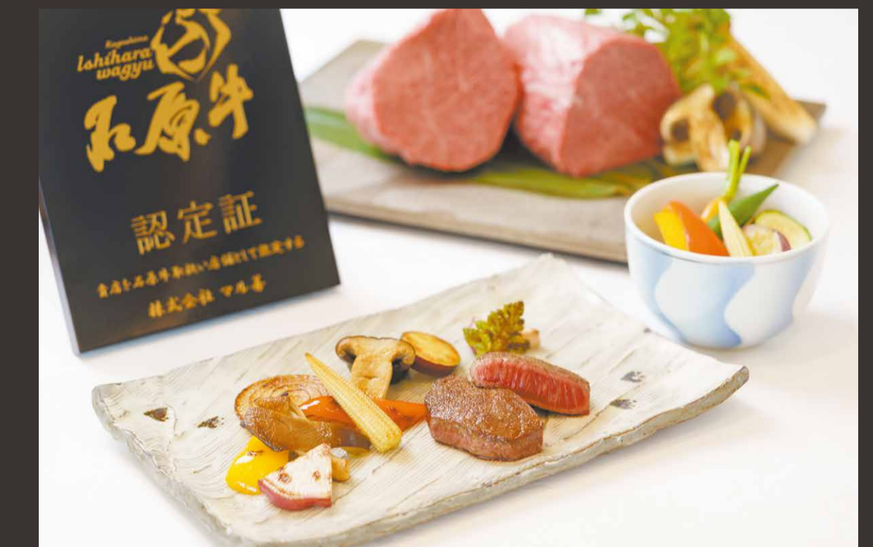
石原牛(ウチモモ/ランプ/イチボ等)鉄板焼き~シェフデモンストレーション~ 季節の野菜鉄板蒸し焼き添え 又は 季節野菜のソテー

buffetボードより好みのメニューとデザートをお選び下さい。 Please Choose Your Favorite Appetizer & Dessert from The Buffet Board Main Dish of Your Choice