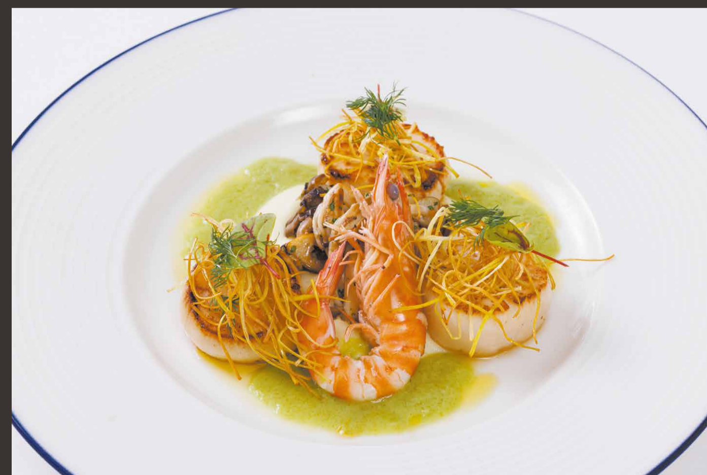
帆立貝のソテーと宮古産車海老、カリフラワーのピューレと木の子のロースト ポワロー葱のソース Sautéed Scallops and Miyako Prawn with Cauliflower Puree, Roasted Mushrooms and Leek Sauce.